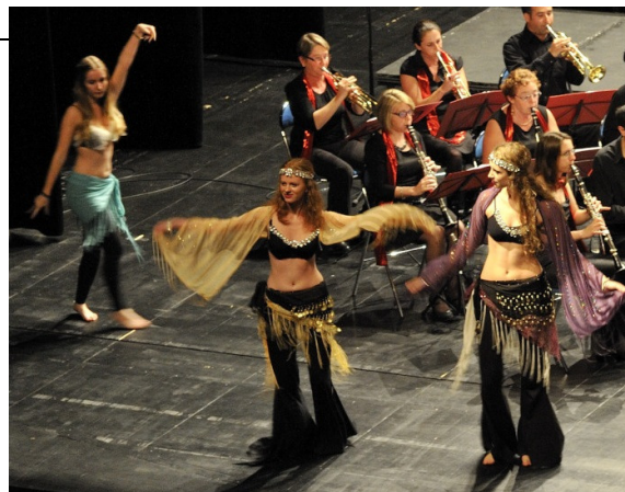
Le mirage 2014