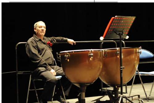
C'est dur la vie de musicien

Nous sommes en Janvier donc je ne manquerai pas de vous souhaiter une excellente année 2015.